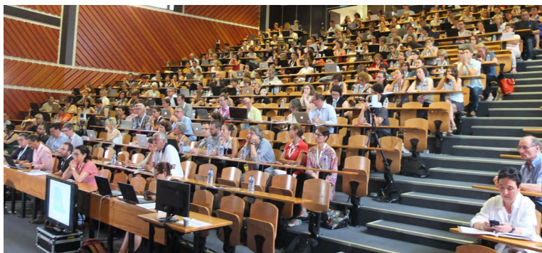
Amphithéâtre Marcel Simon de la faculté de médecine de Rennes

Les web conférences sont proposées à distance, en soirée de 18h30 à 20h.